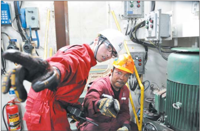
中外方员工精诚合作，共同提升施工质量效率。

身体力行才是消除隔阂、团结协作的密钥，经过这一次午夜抢险，弗朗西斯认同了“中国方式”，中方员工也改变了“非洲看法”，其他外籍员工也逐渐适应胜利海洋铁军的