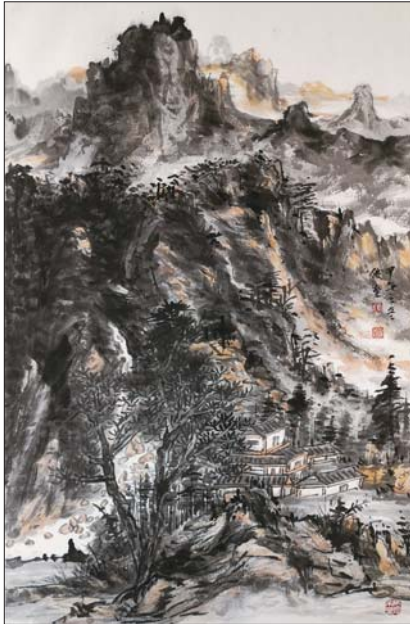
丘壑无言之一 68x45cm 2014年 张俊奎