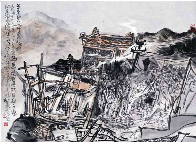
年家峪写生 56x41cm 2019年 王竞艺