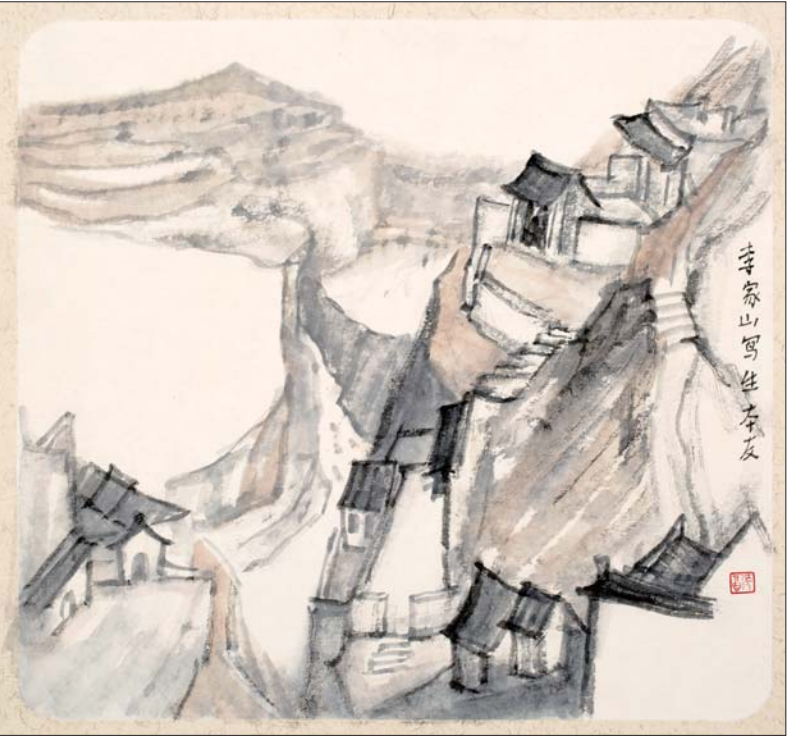
山西李家山写生系列之二 张本友

张俊奎，字微明，号云行，青岛莱西市人。斋署微明堂(北京)、茂陵山房(济南)、望岳山房(泰山)、方山别业(灵岩寺)。毕业于中国国家画院曾来德工作室，现为济南市政协书画院画家，民革山东中山画院画家，民革党员，自由作者(诗歌与美术评论)。