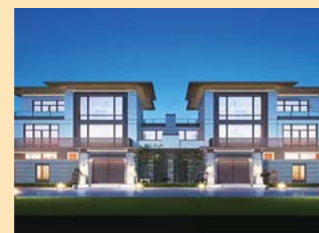
九巨龙·龙城华府(济宁)

东昌天悦项目总占地131亩,建筑面积25万㎡,由孟达、荣盛、金科三强合作,打造聊城新城芯高端居住社区。社区规划“一环、一带、两轴、九境”景观轴线,丰富不同年龄层次居住体验,让居住成为享受。社区采用一线精装品牌精装交付,提升居住品质,带来居家的舒适度。