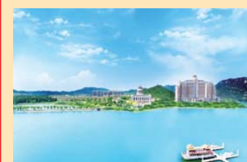
恒大金碧天下(莱芜)

蓝石大溪地紧临经十大道,经五国十一家国际大师团队匠心倾筑,拥有25万平米私家园林,10万平米原生白鹭湖,物业类型包括别墅、电梯花园洋房、瞰景小高层等,自建国际标准网球场、篮球场、湖畔会所等适用于全龄段人群居住。六大服务体系从24H管家服务、秩序维护服务、环境维护服务、基建维护服务、宠物活动区及特色服务出发,护航业主美好生活。