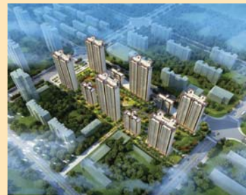
碧桂园·江山域(日照)

天泰·御园是天泰集团深耕滨州第二子,品质升级力作。天泰集团根植齐鲁,25载时光淬炼,致力于用建筑读懂人居,臻造千亩大盘天泰城,高端江南文化住区天泰·桃花源等标杆项目,筑写城市美好生活。天泰·御园择址中海片区,政府规划环中海综合服务中心,坐享发展红利。“三院一中心”现代医疗,万达广场等商超荟萃,一体化生活主场。