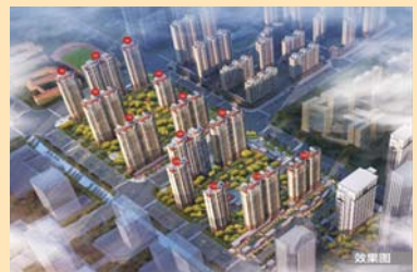
济南恒大滨河左岸

天鸿公园大道是天鸿地产开发了十年的万象新天项目的升级作品。项目位于凤凰路与响泉街交叉口东,项目占地约12.1万㎡,总建筑面积约46.7万㎡。项目周边交通、生活、教育配套已经非常完善。交通方面,距新东站约1.3KM,距离地铁R3线裴家营站约600米,教育配套方面,万象新天学校开学7年,成为历城区新建学校中教学成绩名列公办学校前茅。