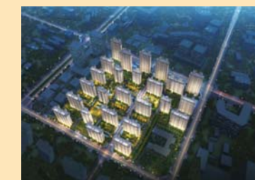
鲁商金茂· 旅游路国际社区

绿地集团聚焦自身产业转型升级,积极响应国家政策部署,全面助力山东新旧动能转换,以“生态为基、产业为本、产城融合”的发展理念,于雪野湖畔打造国家特色小镇项目、颐养山东示范项目、绿地集团标杆项目——绿地·雪莱小镇。以五大康养服务、四全服务体系打造小镇360°健康生活。