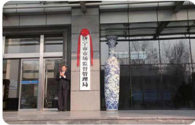
济宁市市场监管局揭牌成立。

第七届山东省省长质量奖评选中，济宁获得1个正奖、2个提名奖，数量位居全省第1。4个国家标准化试点项目顺利推进，众和社区卫生服务中心将618项基层医疗服务项目全部纳入体系建设，鲁南地区农业标准化培训示范基地落户济宁。