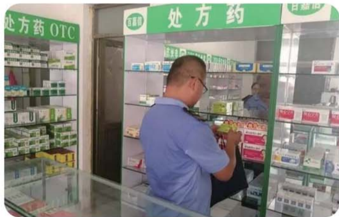
开展药品专项整治行动。

锻造市场监管铁军。坚持“政治建局、专业立局、执行强局”，积极创建政治型、务实型、廉洁型、和谐型“四型机关”，组织召开机关第一次代表大会，深入开展“省内学青岛、省外近学徐州、远学深圳”对标学习活动，扎实推进“不忘初心、牢记使命”主题教育。组织“市场监管进社区，服务民生零距离”活动，展现出“最美市场监管人”的时代风采。