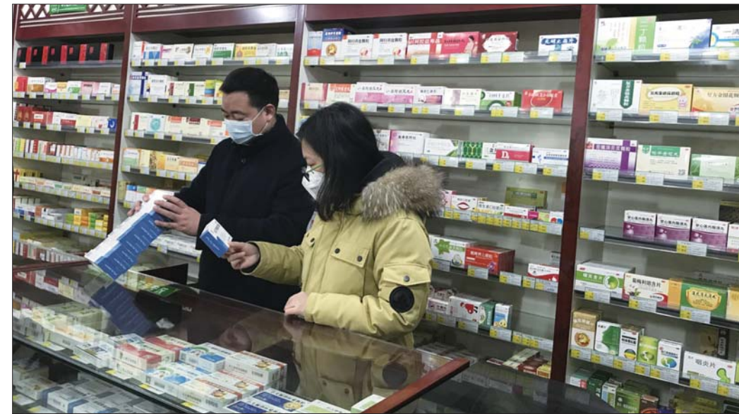
工作人员抽检药品。