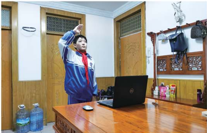
一名学生在家中参与线上升旗仪式。

活动。如学校定期传送的美篇;红领巾助力,少先队员以征文、手抄报、一封信等形式抗击疫情;初一体育课堂在家视频学习《八段锦》及手语操《不放弃》……为使同学们在家也能度过愉快而有意义的学习生活,学校全体领导和老师纷纷积极献言献策,让空中课堂的互动形式更加丰富多彩,引人入胜。