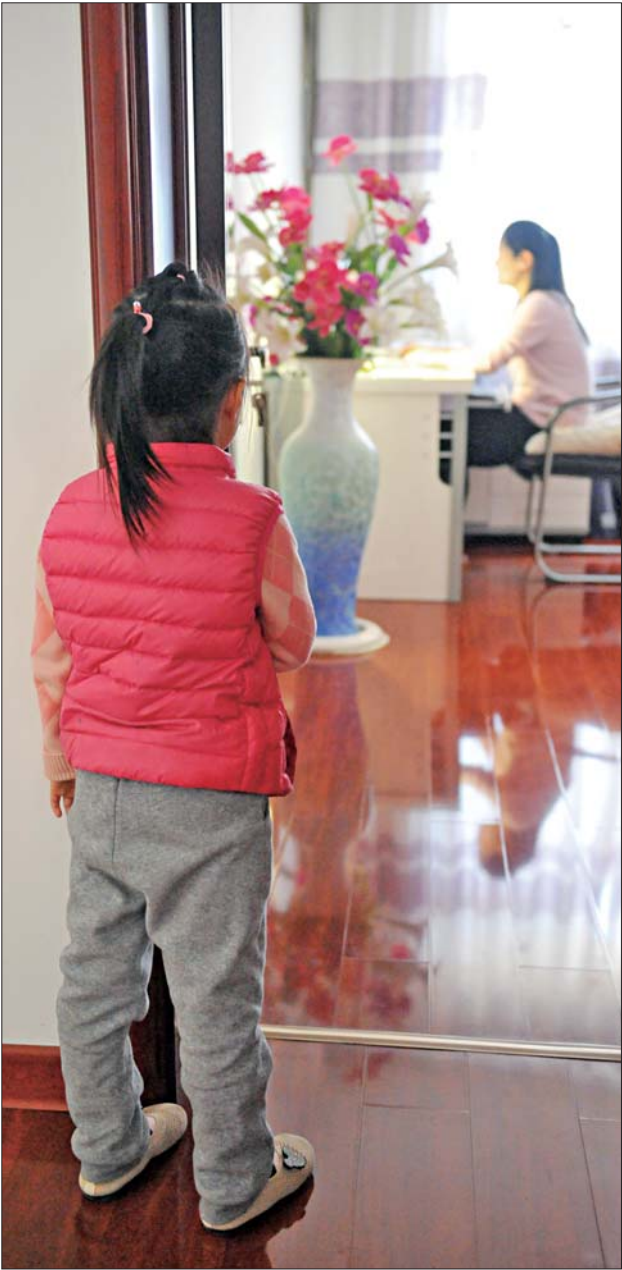
祝老师办公时，乖巧懂事的女儿从来不去打扰。