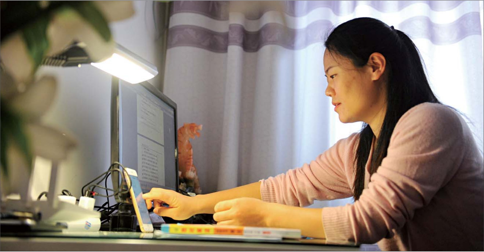
电脑、手机双管齐下，网上直播、隔空对话改变了祝老师的授课模式。