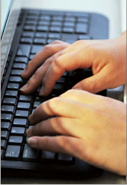
长时间敲击键盘，祝老师手指时感麻木。