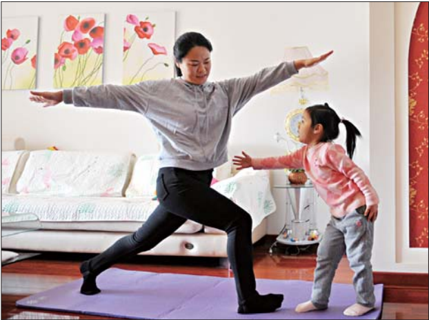
每天的工作量很大，祝老师尽可能找出时间跟女儿一起健身，放松一下筋骨。