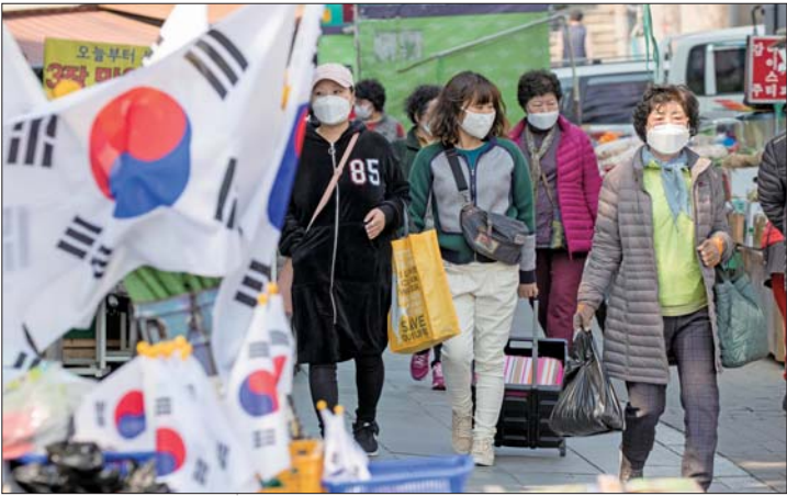
▲3月17日,在韩国大邱,人们佩戴口罩在西门市场附近出行。

美国约翰斯·霍普金斯大学16日发布的数据显示,中国以外新冠肺炎确诊病例数超过10万。数据显示,截至美国东部时间16日19时30分(北京时间17日7时30分),全球新冠肺炎确诊病例升至181377例,中国以外确诊病例超过10万例。中国以外确诊病例最多的5个国家为意大利、伊朗、西班牙、韩国和德国。不过,今天传来了一些全球疫情防治方面的好消息,意大利有出现拐点的趋势,伊朗也表态称战胜疫情很有希望。