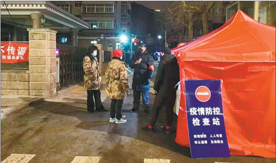
督导组夜间到社区卡口检查防疫举措落实情况。

“各基层单位的工作人员在日夜加班防控疫情,区纪委监委机关有关部门和各派驻派出机构在严格纪律检查督查同时,一定要注意语气态度,要把组织的关怀问候带给基层一线同志,不添乱不添堵。”市中区委常委、区纪委书记、监委主任王蒙多次在会议上和工作群中提醒纪检干部,要求大家从关心基层干部的角度精准监督提醒,帮忙不添乱、到位不越位。