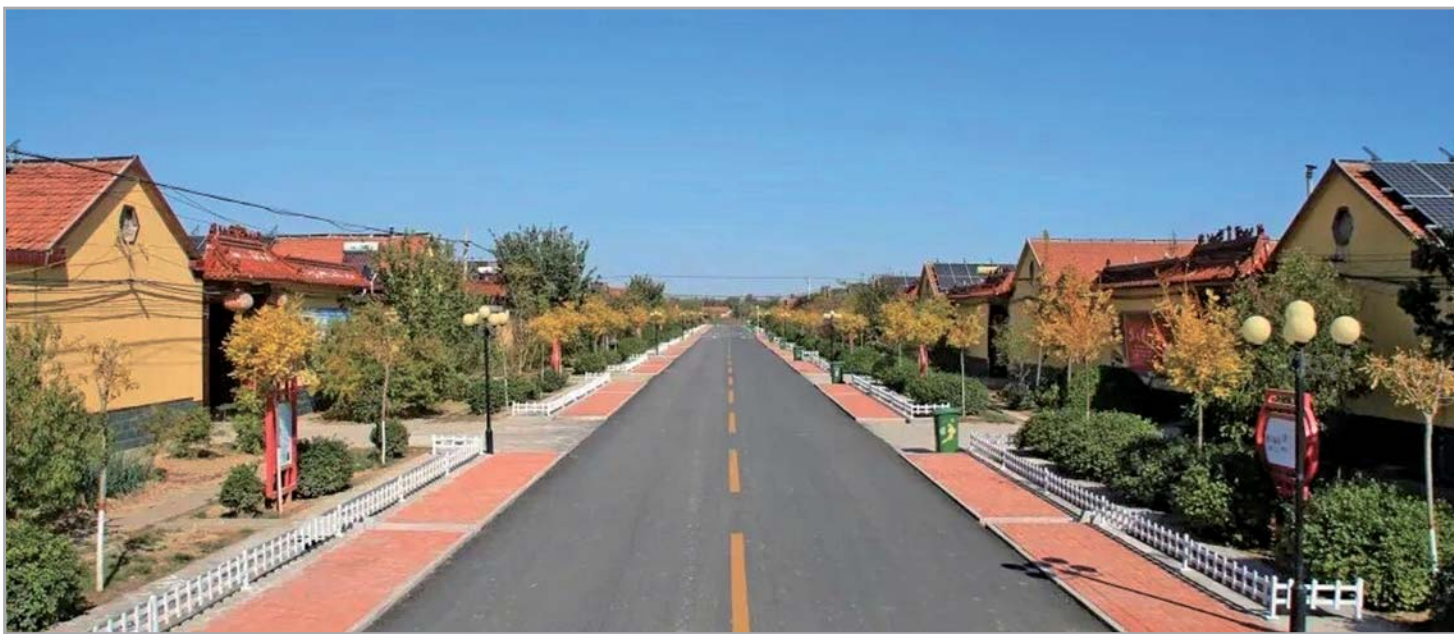
商河县交通运输局致力于建设人民满意交通。

为贯彻落实全县重点工作推进大会精神，扎实推进教育强县、农村新型社区、城市建设三项重点工作，3月13日下午，商河县交通运输局召开贯彻落实全县重点工作大会暨“百日攻坚战”誓师大会，自即日起至6月底，在全局开展“大干一百天，打赢攻坚战”专项行动，以开局就是决战，起步就是冲刺的劲头，迅速掀起项目建设高潮，决战全年目标任务！