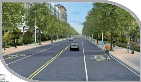
市政道路建设弘德街西延效果图。