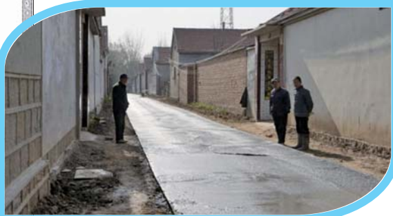
户户通工程修到村民心坎上。