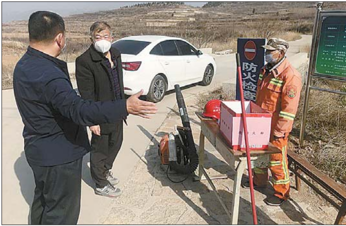
检查组查验森林防火检查站。

增配分类投放、收集、运输设施设备。垃圾分类投放、收集、运输设施设备要符合密闭、机械化作业要求,颜色、标识统一规范;按照有害垃圾、可回收物、易腐垃圾、其他垃圾四分类要求,在运输过程中不得混装混运。城市新区开发、旧城改造以及新建住宅小区、新建(改扩建)集贸市场等,充分考虑垃圾分类要求,同步规划、同步建设、同步投入使用垃圾分类设施;有条件的新建住宅小区、集贸市场可同步规划、同步建设、同步投入使用易腐垃圾就地处置设施。对有害垃圾、可回收物、易腐垃圾和其他垃圾采取定时、定点、定人的方式收运,并建立分类统计台账和数据统计体系,加强示范社区(村)的建设,打造高标准垃圾分类模式。探索试点“定时定点+预约收运”的垃圾不落地、不混装收运体系,力争6月底前各街镇至少完成两处试点,年底前逐步减少或取消现有的生活垃圾收集桶,党政机关、公共机构、学校、医院垃圾分类覆盖率达到100%,相关企业垃圾分类覆盖率达到80%。加强示范社区(村)建设,打造高标准垃圾分类模式,力争2020年10月底均达到精准“四分类”全覆盖的标准。