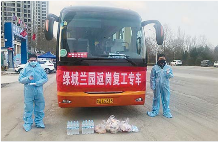
返岗复工专车为建筑项目开工保驾护航。

复工复产服务队,建立局领导帮挂台账,明确每一个项目由一名领导牵头服务,一个责任科室靠上服务,“一对一”“点对点”“个性化”上门对接服务,对项目复工复产中遇到的问题和困难及时帮助解决;积极为开工企业协调解决防疫急需的口罩、电子测温计等