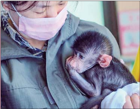
济野首次人工培育的小狒狒也与游客见面了。