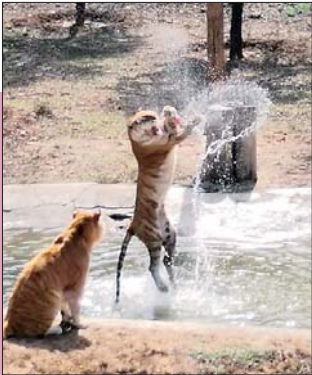
看到了游客,连老虎都撒起了欢。

经历了54天漫长的等待,动物们抖落冬日的困倦,纷纷活跃了起来,踏着青青草地爬树、跳跃、撒欢儿,玩得不亦乐乎…… 3月20日,济南野生动物世界恢复开园,全球首位动物情报员熊猫“二喜”等动物精灵们再次与游客见面。