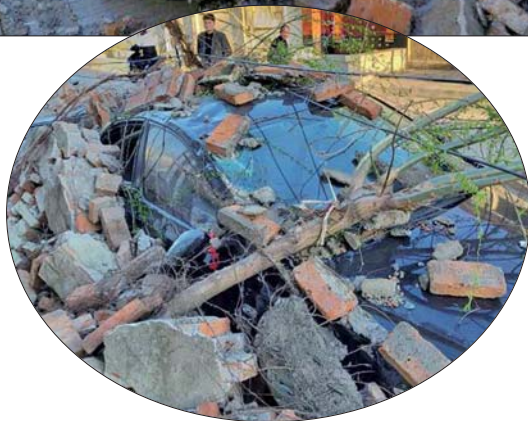
►被砸车辆之一受损严重。

本报泰安3月20日讯(记者 张伟 见习记者 金文茜) 3月18日晚上10点左右,大风刮倒了泰安凤台村委附近一条路南侧的围墙,三辆私家车和一辆电动三轮车被砸,损坏严重。 3月20日中午,齐鲁晚报·齐鲁壹点记者在事发现场看到,有一处围墙倒塌,露出一个十余米的豁口,地上砖头和泥沙碎末散落一地。被砸车辆还剩一辆轿车和一辆电动三轮留在原地,小轿车临时用车衣遮挡起来,电动三轮南侧车窗玻璃破碎,前轮受损变形。用车衣遮盖的轿车是一辆桑塔纳轿车,揭开车衣,可以看到车右侧、车尾及车顶都有损坏。 事发在3月18日,泰安发布大风蓝色预警,夜间阵风达到7级。当天下午,泰安市民王先生下班后,像往常一样把自家的斯柯达轿车停在家门的围墙一侧。起风后,王先生在屋里听到,大风刮着门窗“呜呜”响。晚上10点左右,有人电话告知王先生的父亲,说大风刮倒了围墙,王先生的车被砸了。“我出门一看围墙