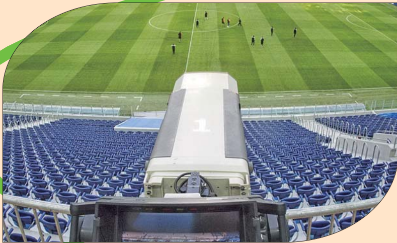
欧洲杯延期牵涉到转播商等各方的利益。