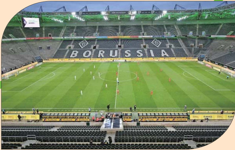
没有球迷的足球比赛失去了魅力。