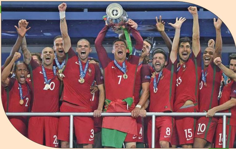
2016欧洲杯的举办，成为欧足联的成功范例。

从赞助商角度看，延期增加成本是一定的。在这个时间节点上延期，赞助商先期的很多人力、物力已经投入进去了，先前投入的收益周期延长，如此一来收益或多或少将打折扣。此外，一些短期赞助的合作方，也有可能抽身。不过，也有赞助商打出了“明年春色倍还人”这样的标语，以表达对2021年欧洲杯的期待。