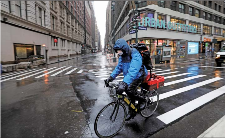
3月23日,一名外卖送货员戴口罩骑行在美国纽约空荡的街头。