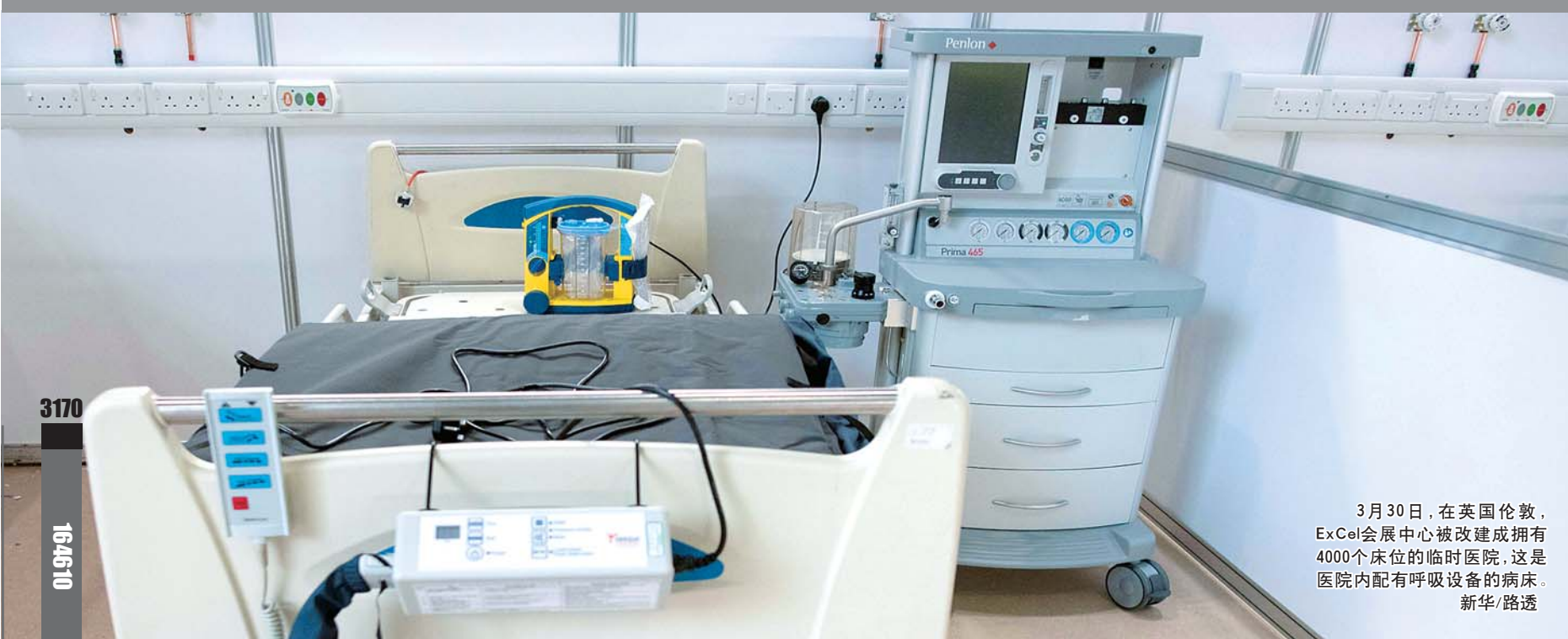
3月30日,在英国伦敦,ExCel会展中心被改建成拥有4000个床位的临时医院,这是医院内配有呼吸设备的病床。