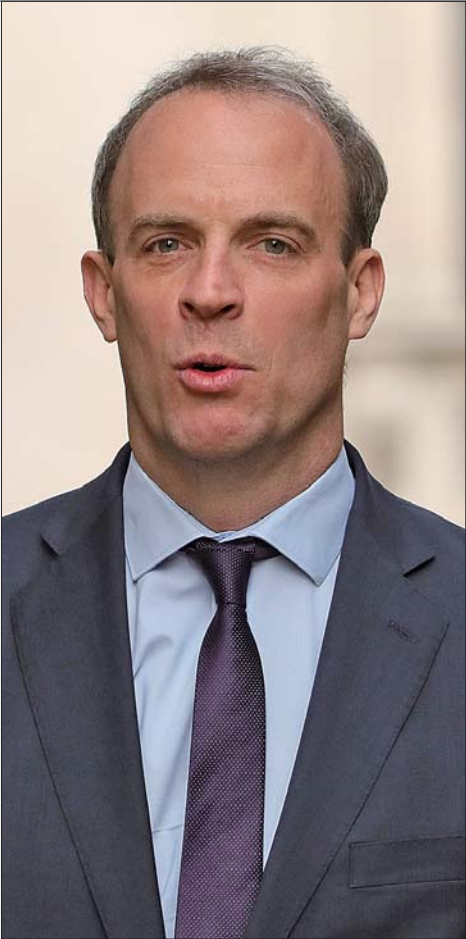
英国外交大臣拉布