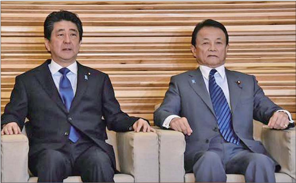
日本首相安倍晋三和副首相兼财务大臣麻生太郎(右)。

英国政府当地时间9日宣布,由于病情有所缓解,首相约翰逊已离开重症监护病房(ICU)。自6日住进ICU后,这位首相连带着整个英国,跟着一起虚惊一场,很多英国人自此才惊觉,他们之前好像并没有为首相万一倒下后谁来顶班做好充足准备,放眼世界,给首脑找“备胎”,确实是个敏感而时常被忽略的话题。