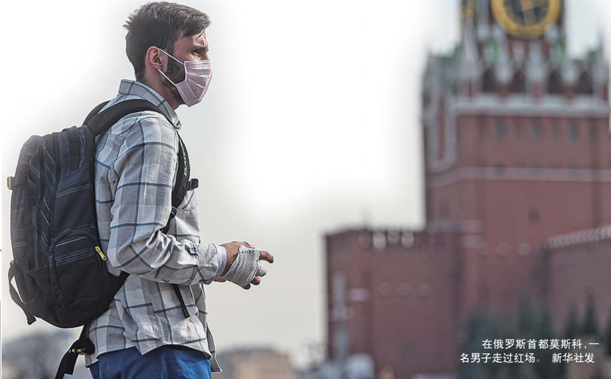
在俄罗斯首都莫斯科,一名男子走过红场。

根据京沪高速公路莱芜至临沂(鲁苏界)段改扩建工程施工需要,定于2020年4月15日上午6时至2020年4月15日下午18时对G2京沪高速莱芜东枢纽以北主线上海方向往淄博方向道路封闭施工;请广大驾驶员提早做好出行规划,合理安排出行路线,按照交通标志指示有序通行。 施工期间给您带来不便,敬请谅解。 特此公告!