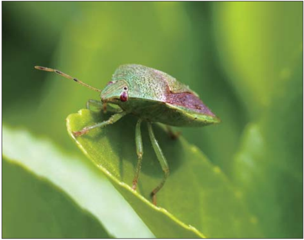
济南小清河畔的小精灵。王兴泉 摄 佳能EOS 7D Mark II 100mm f/2.8 选自《泉城影苑》栏目