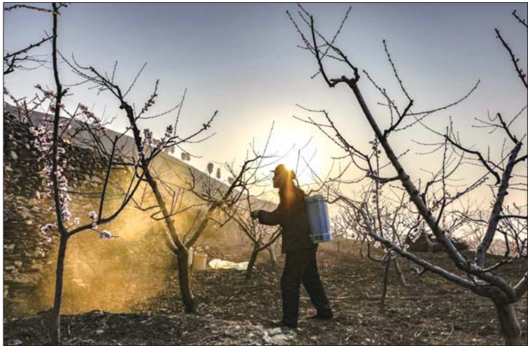
▲人勤春早。阙士亮 摄 佳能EOS 5DS R f/5.6 1/5000s ISO400 选自《拎机一动》栏目