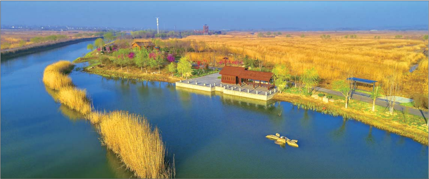
马踏湖春韵。宋开才 摄 大疆无人机 f/5 1/250s ISO100 选自《瞰齐鲁》栏目