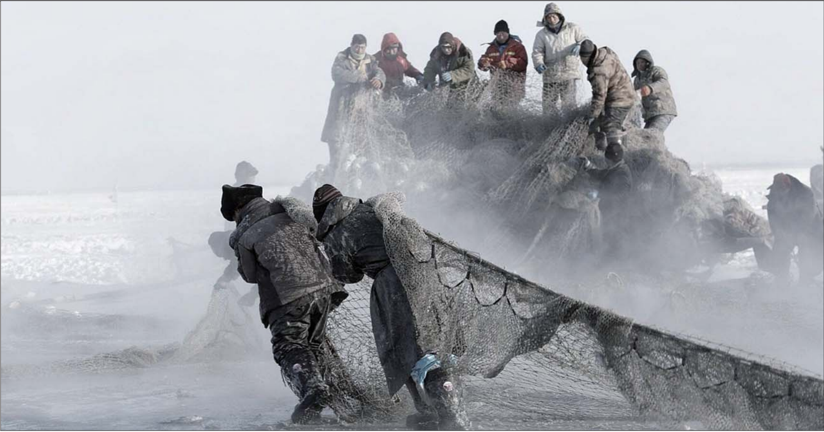
查干湖冬捕。佳能EOS 5D Mark IV f/9 1/125s