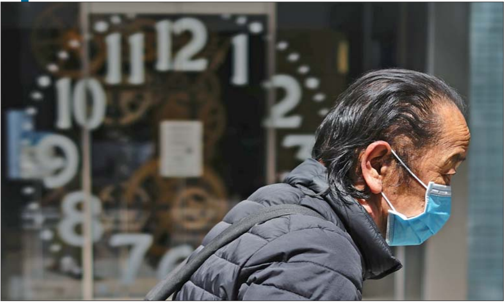
5月7日,在日本东京,一名佩戴口罩的男子走过窗口。

1月30日,世界卫生组织宣布新冠疫情构成“国际关注的突发公共卫生事件”,正式拉响全球最高卫生警报。今天,这一“全球最高警戒状态”迎来第100天。目前,全球病例总数已接近360万,死亡人数超过24万。回顾全球战“疫”的百日期程,带给人们诸多反思和启迪,既有感动与感慨,也有无奈和叹息。