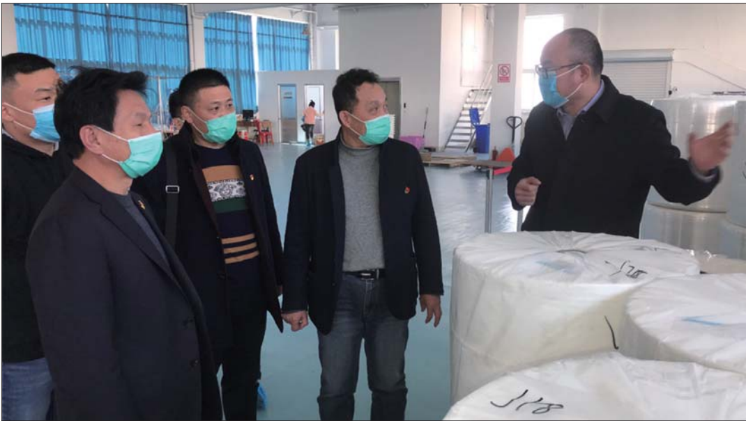
与企业人员现场交流。

活动中,通过优惠政策“上门送”,实现“政策找企业”,全面打通政策落地“最后一公里”。全市已向小微企业和个体工商户发放低息贷款11亿元、创业担保贷款3.18亿元,为个体工商户减免社保费103万元、房租1705.23万元,为9.1万户小规模纳税人减免增值税1亿元,对符合条件的纳税人免征增值税1242.7万元,实行电气阶段性降价、欠费不停供措施,为3582家企业办理电气缓交业务,缓交金额2836.3万元,为2115家企业降低用气成本803万元。