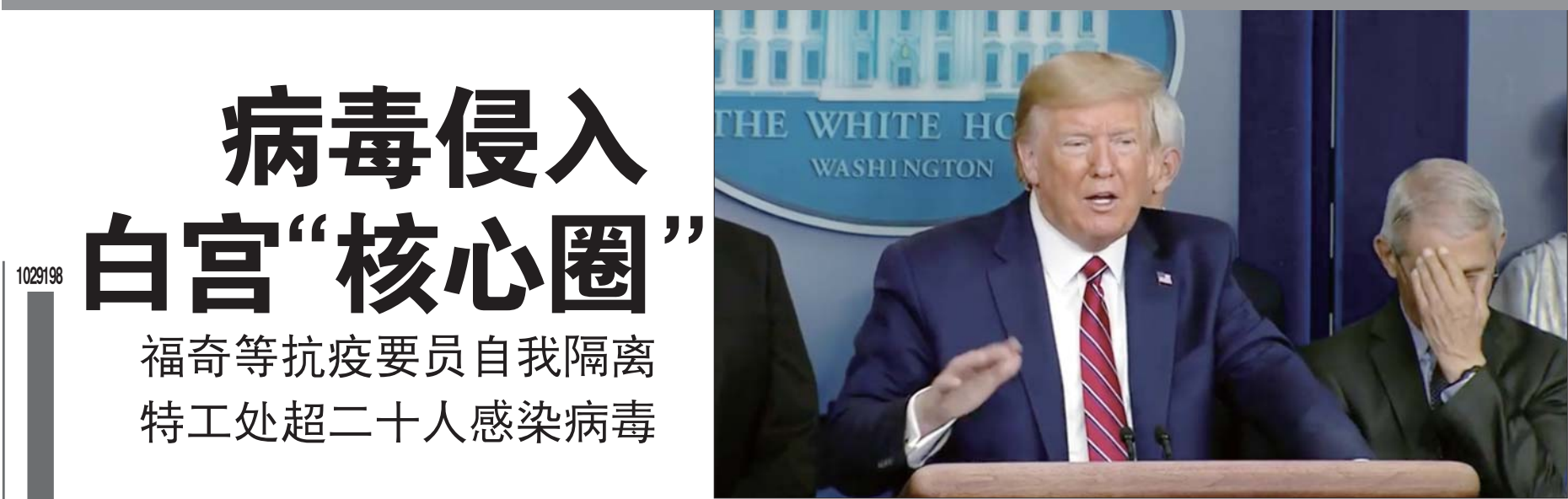
特朗普关于疫情的讲话经常让福奇(右)无所适从。