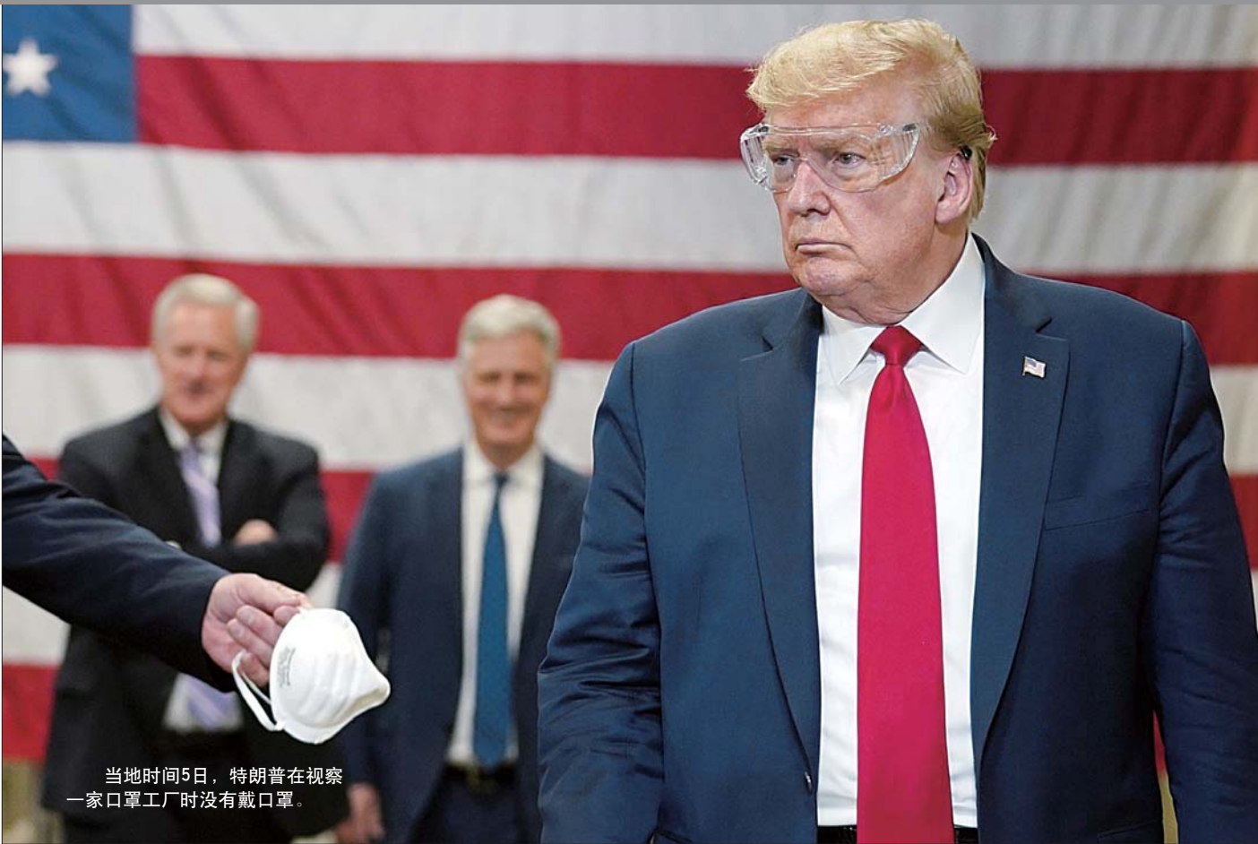
当地时间5日,特朗普在视察一家口罩工厂时没有戴口罩。