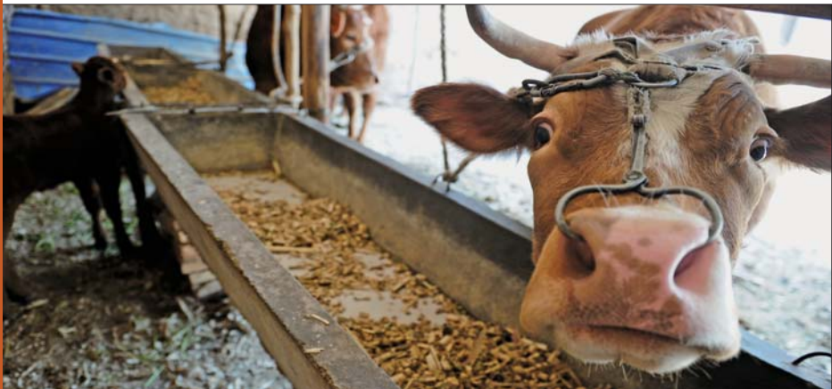
见到陌生人,“牛妈妈”立刻警觉起来。

阳信县扶贫办副主任冯研翠介绍,政府每年投入4000多万元用于扶贫,通过政策扶持加贫困户自己努力,一些贫困户成功脱贫,本着“脱贫不脱政策”的原则,阳信县将继续通过扶贫政策巩固脱贫成果。