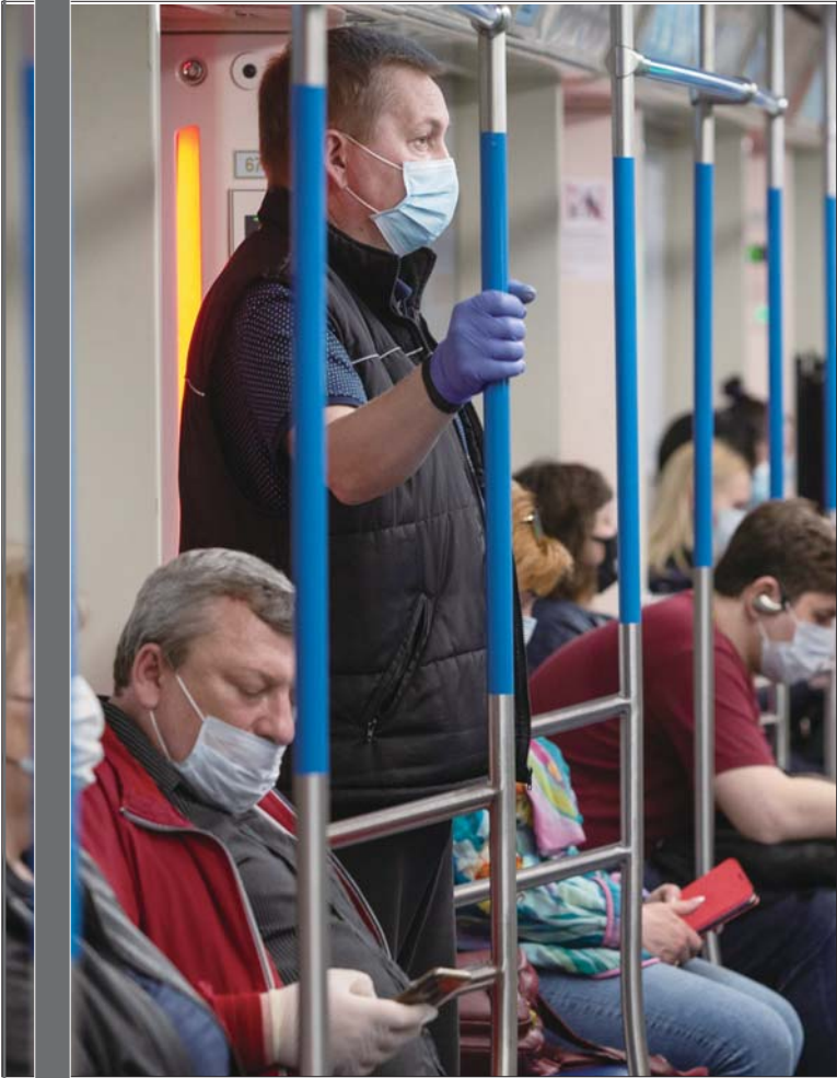
▲5月12日，在俄罗斯首都莫斯科，人们佩戴口罩和防护手套乘坐地铁。

俄罗斯12日正式结束6个多星期的全国性统一“休假”，部分地区、行业开始复工。然而，俄罗斯近几日新增新冠病例仍呈上升趋势，据央视新闻报道，俄罗斯单日新增确诊病例已经连续11天过万。目前，俄罗斯是全球累计确诊人数第三高的国家。在此情况下，能否平衡好解禁与抗疫，对俄罗斯来说无疑是种考验。