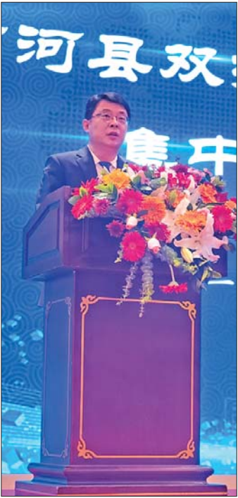
商河县委书记翟军致辞。

在疫情防控形势逐渐明朗的当下,该县又推出了今天这种主、分会场同步签约的新模式。线上见证,线下握手同频共振,网络视频、融媒直播交相辉映,共同助推项目早签约早落地。