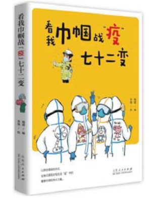
《看我巾帼战“疫”七十二变》 姚建 编 李强 绘 山东人民出版社

贡献和精神值得被珍藏、被珍惜。为她们留影,为历史留痕,是新闻人、漫画人的责任。人是最生动的历史,记录历史,最重要的是记录人。中国女性事不避难、义无反顾的身影因为这本书的出版被永久定格,成为历史底稿的一部分。