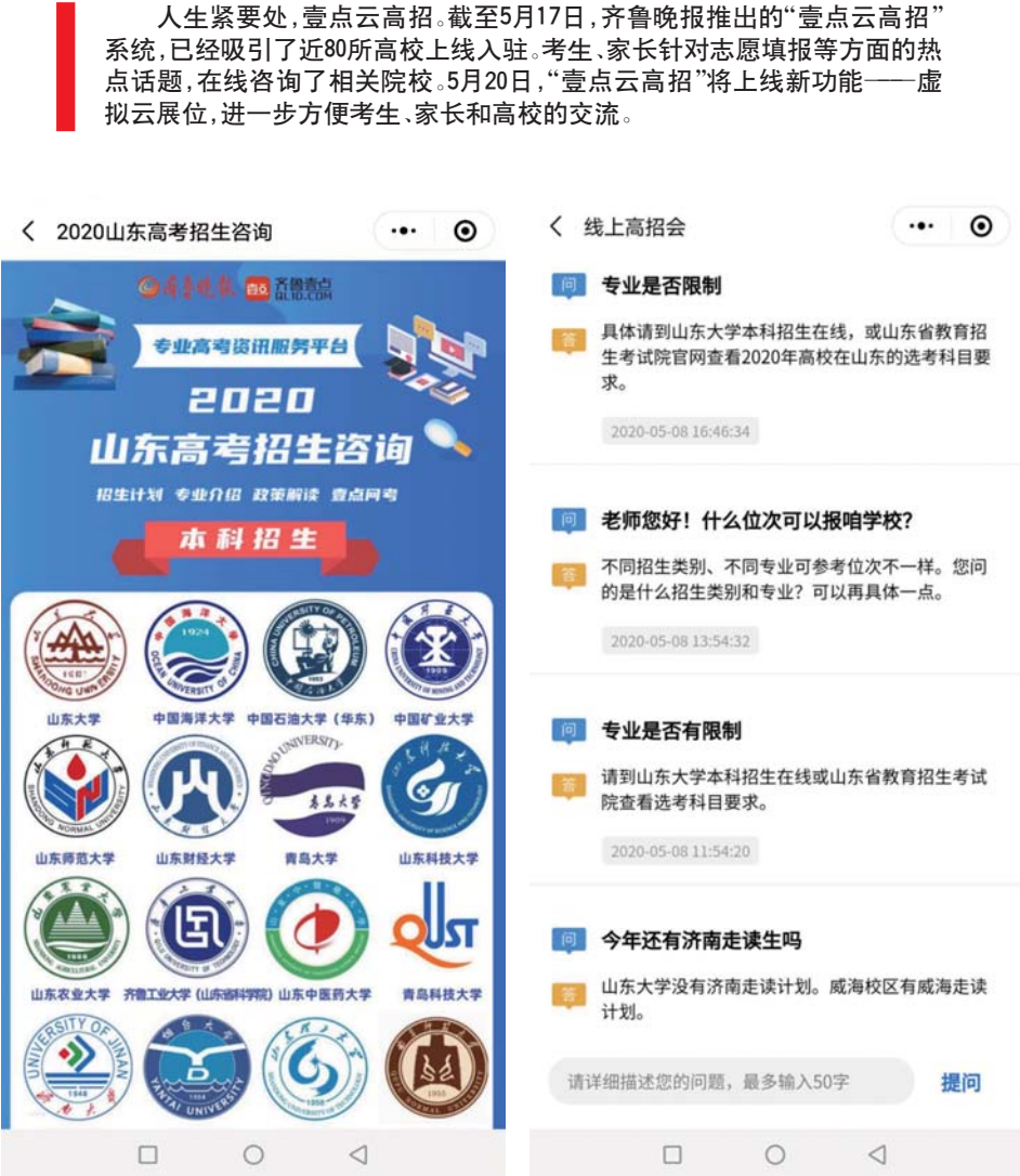
“壹点云高招”系统,已经有近80所高校上线入驻。

在“壹点云高招”产品上线后,齐鲁壹点客户端的高考频道已经紧随头条频道,成为了固定板块。高三考生及其家长无需订阅即可看到该频道,能随时随地掌握热门高考咨询。