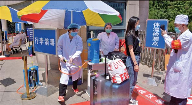
学生返校前,工作人员需要对行李进行消毒。齐鲁晚报·齐鲁壹点记者 王凯 摄

近日,山东高校迎来返校。5月18日上午,山东大学2020年春季学期首批返校学生开始有序返校报到。根据安排,山东大学首批返校的学生为符合返校条件的博士研究生,共有2778人。据了解,为保证安全,5月10日至17日,学校组织一校三地全体在岗教职工和后勤物业、保安人员近12000人进行了核酸检测。