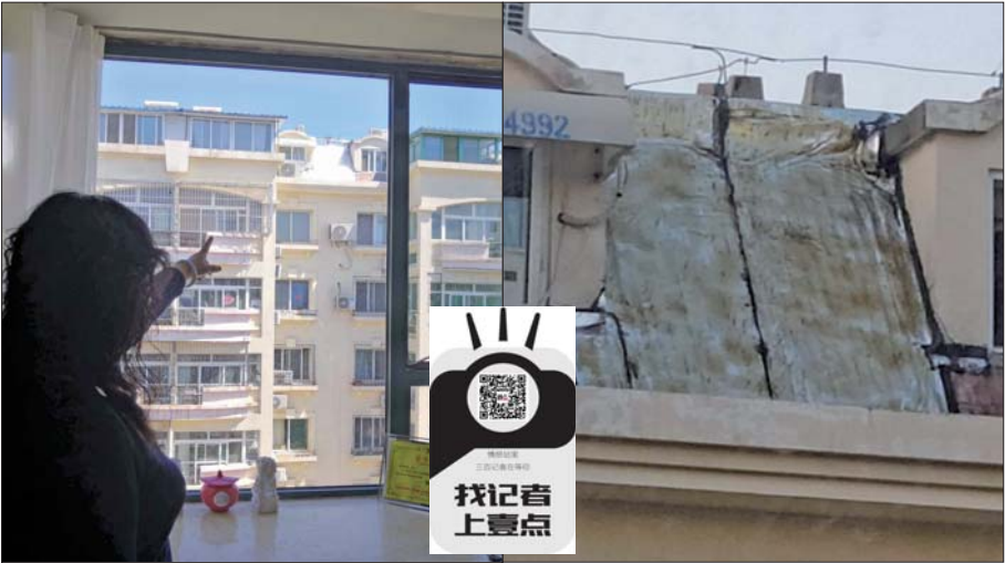
防水层经过喷涂前后对比。

本报5月18日讯(记者 程凌润) 近日,壹粉“素年瑾时2358”通过齐鲁晚报客户端齐鲁壹点发布情报,济南市玉景家园小区一居民楼楼顶斜坡上铺设的银白色防水层造成了“光污染”,刺眼的反光让她与家人不堪其扰。 “金陵嘉和馨园对面的玉景家园楼顶上,不知弄的是太阳能还是防水设置,像个大魔镜一样照射在对面金陵嘉和馨园居民楼的居室内,刺得人睁不开眼睛,即使拉上纱帘也不管事。”壹粉“素年瑾时2358”说,每天上午11点左右反光最为强烈,只要往北侧瞧上一眼就会在眼中形成一个光斑。而这种情况至少持续了半个月。 5月18日,记者来到壹粉“素年瑾时2358”家,发现北侧居民楼阁楼斜坡处反光防水层仅有两三平方米。“因为是两个小区,我们也不知道该找谁,就想求助一下媒体。” “现在防水都是这样,我们没法处理,