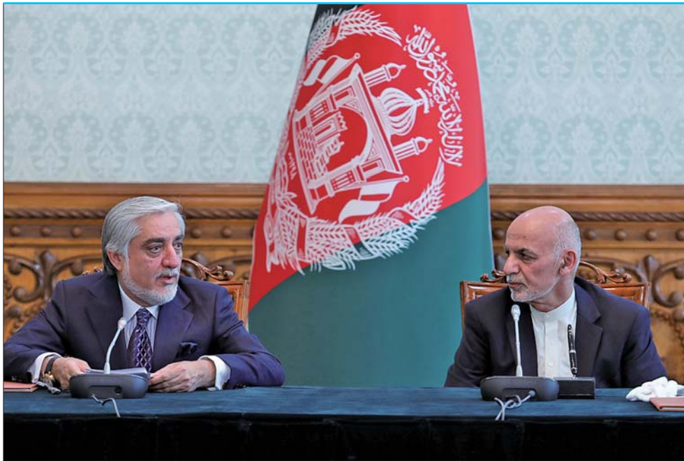
5月17日,阿富汗总统加尼(右)与竞选对手、前政府首席执行官阿卜杜拉在权力分配协议签署现场。