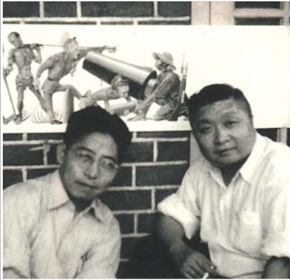
1947年张光宇(右)和丁聪在香港。