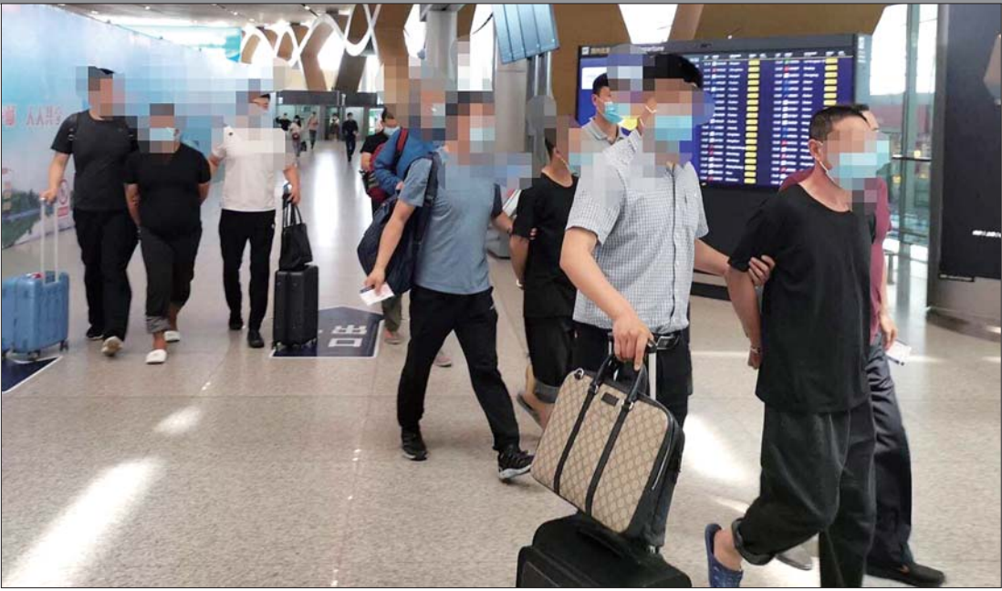
民警将犯罪嫌疑人抓获归案。