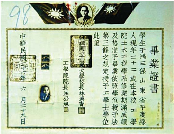
►国立山东大学毕业证书