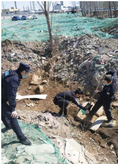
民警在倾倒废物现场进行勘察。

“自从专项行动开展以来,我们已经接到20多条线索,经过侦查已经立案三起,抓获犯罪嫌疑人4名。”郑志勇表示,作为打击食药环犯罪的主力军,食药环大队将恪尽职守,保护美好家园,同时呼吁市民,如果发现身边存在违法犯罪行为,要及时报警,为创建全国文明城市贡献一份力量。