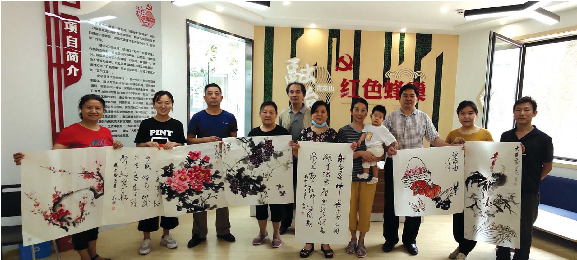
党群活动丰富多彩。