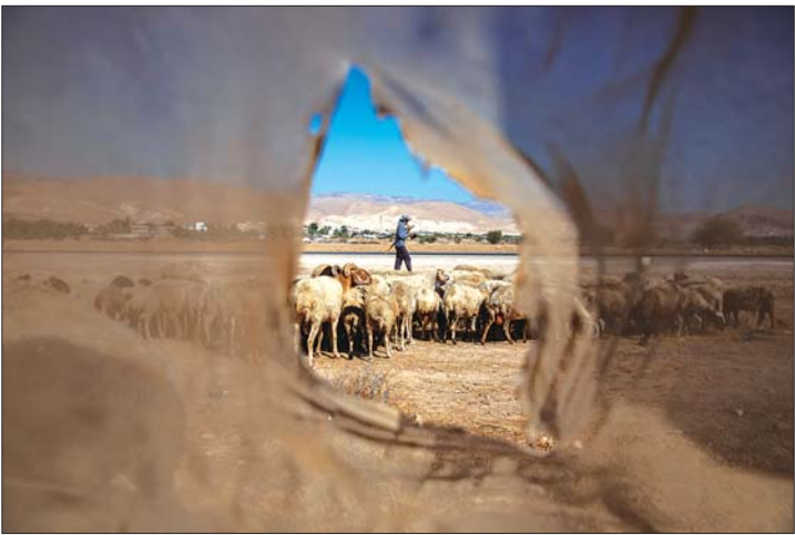
6月30日，一名牧羊人在约旦河西岸一座村庄附近放牧。

7月1日是以色列总理内塔尼亚胡先前设定的开始对约旦河西岸部分地区“实施主权”的日子，但他当地时间6月30日暗示可能不会如期实施这一吞并计划。分析人士认为，以色列国内的新冠疫情、国际社会的强烈反对以及美国的态度是内塔尼亚胡难以按期推进吞并计划的主要因素。但他并不会放弃该计划，或将择机分阶段推进以减小政治风险。