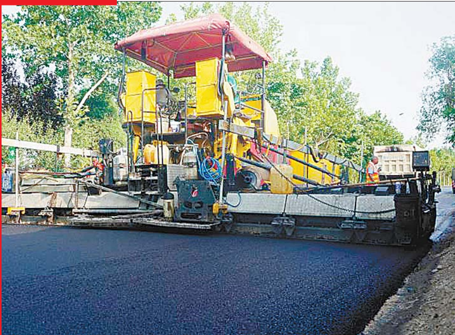
“交通+扶贫”，铺就脱贫致富路。 商河农村道路施工中。