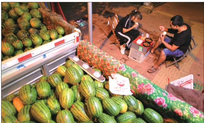
▲晚上11点半，夫妻俩在摊位旁吃晚饭，这是一天里的第二顿饭。