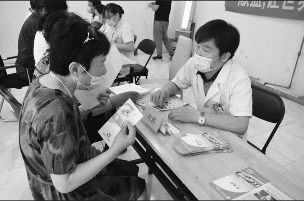
医护志愿者们为前来问诊的群众答疑解惑。

本报济宁7月6日讯(记者李锡巍 通讯员 康宇) 为大力传承弘扬“奉献、友爱、互助、进步”的志愿者精神,6月份,济宁市第二人民医院党团志愿者服务队联合邮电新苑社区、红星八号、红星九号、欣雅苑社区共同开展系列义诊活动,以实际行动为社区居民送温暖、送健康。