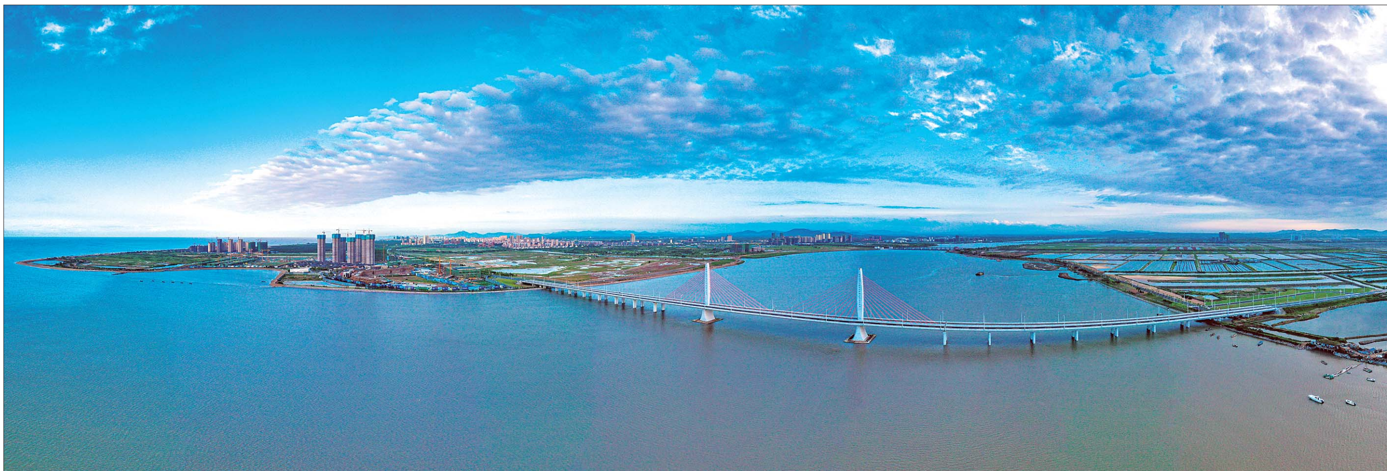
金奖《南海之晨》