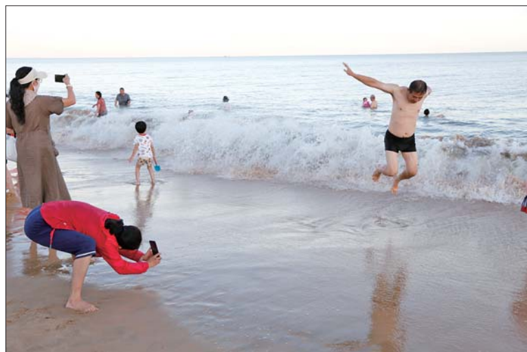
铜奖《南海我来了》