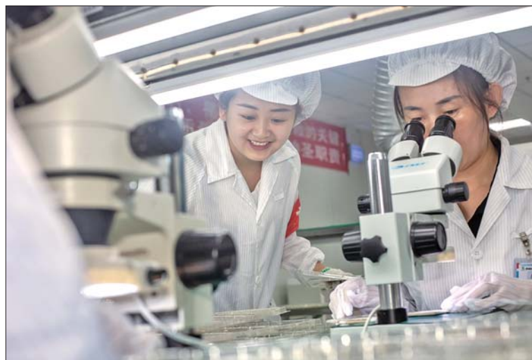
银奖《见微知著》