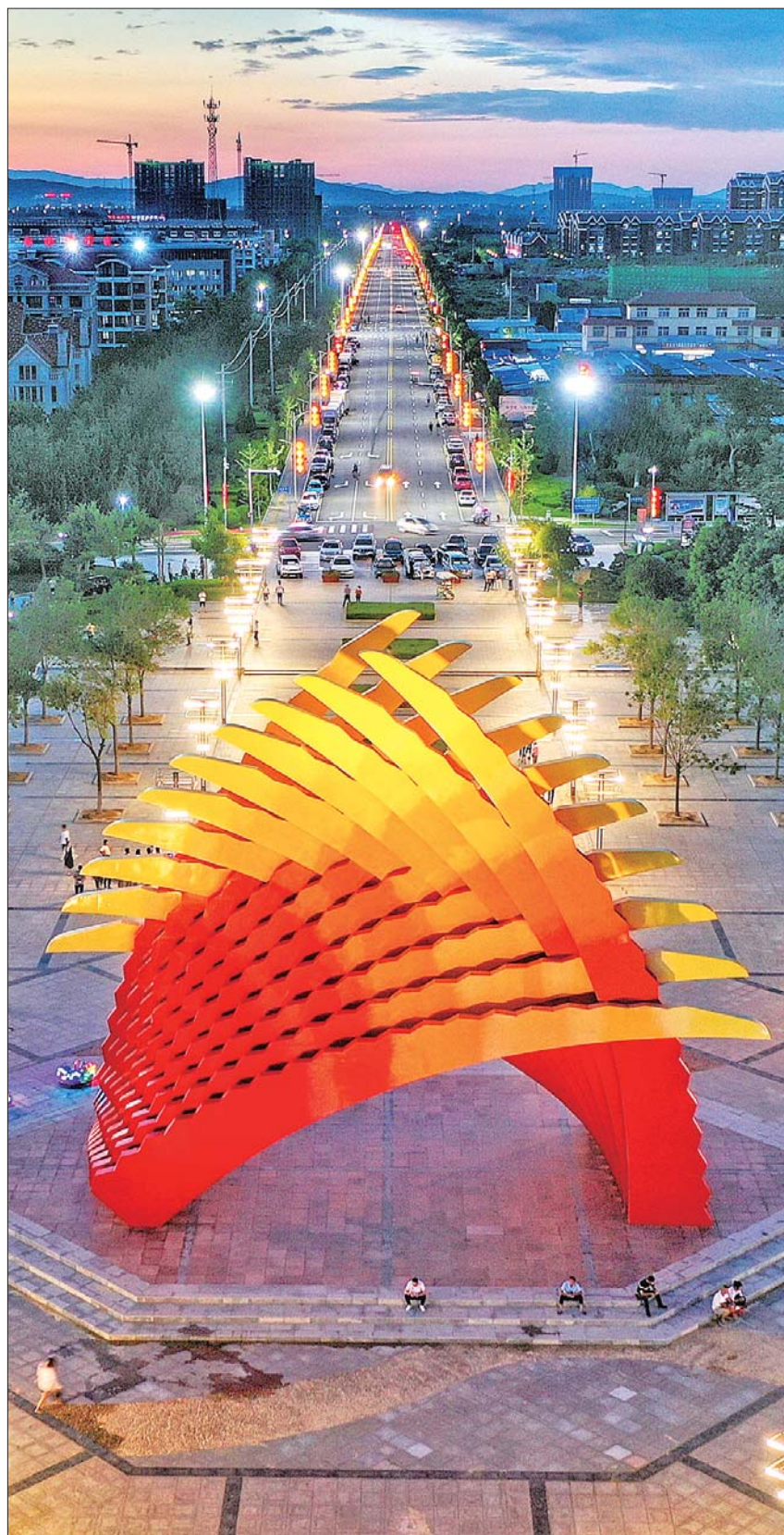
银奖《手牵手》