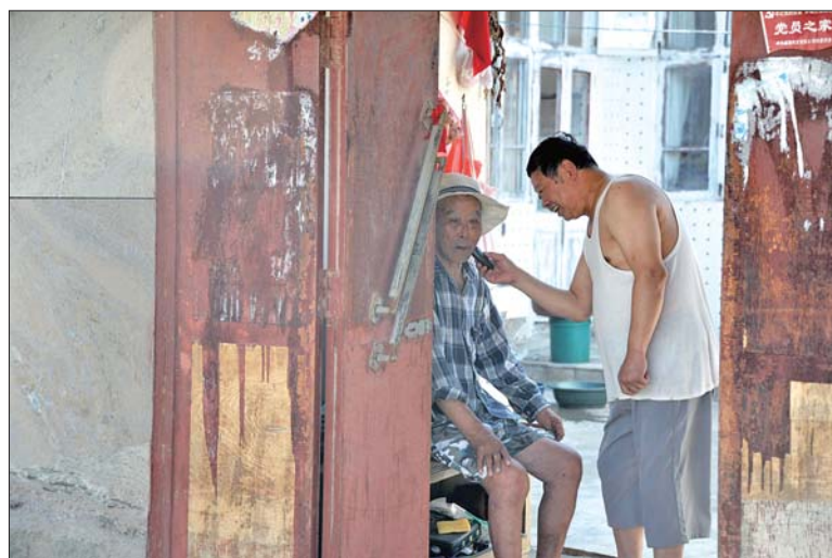
银奖《威海好女婿》