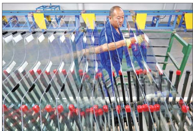
金奖《多彩流水线》

融媒时代,如何守正与创新是广大新闻工作者面临的共同课题。与会代表在这次同场竞技的采风活动中,八仙过海各显神通,拿出看家本领,用自己的镜头和独特的视角讲述一个盐碱滩上神奇的嬗变,展现一个美丽新区最精彩的时代影像。