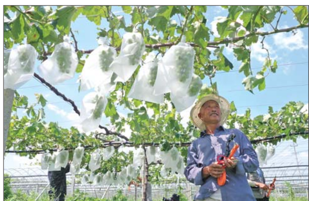
银奖《待丰年》