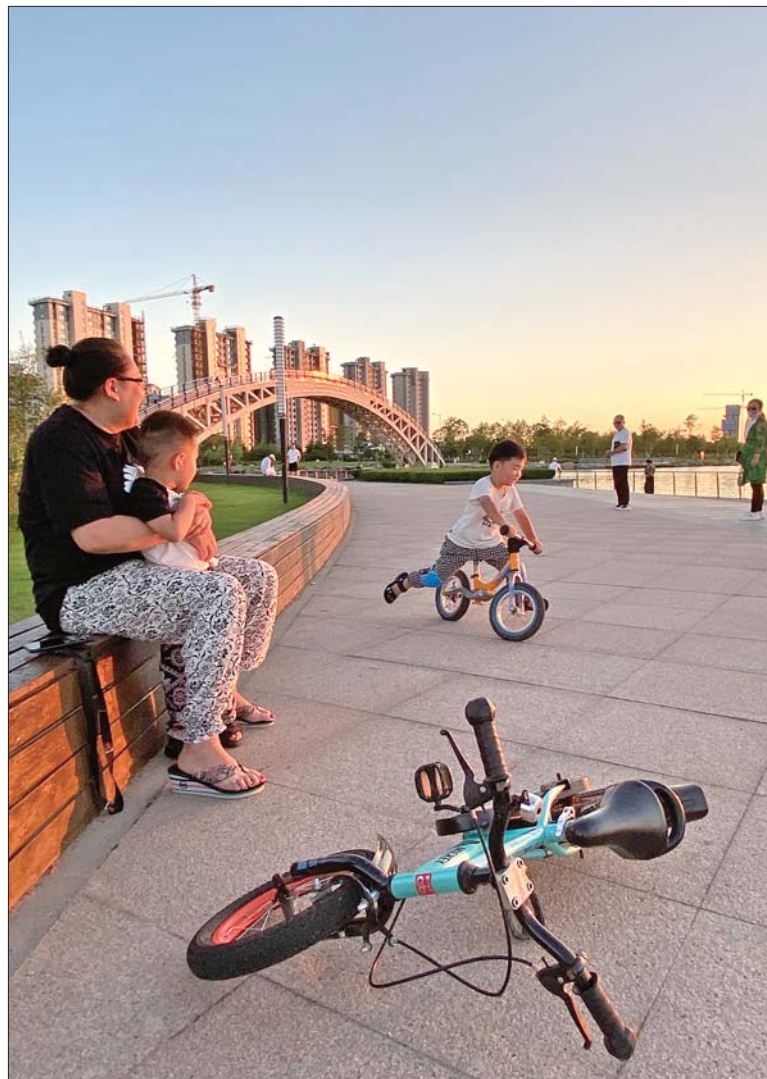
佳作奖《看我的表演》