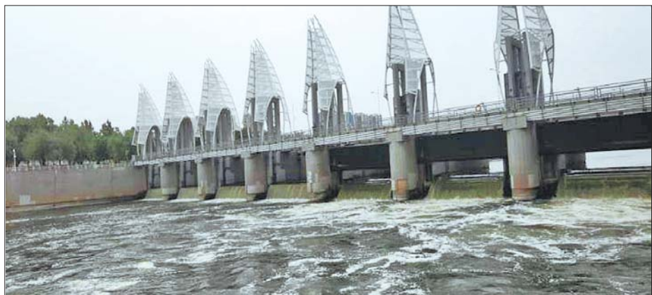
小清河洪园闸7孔大小闸门全部开启。