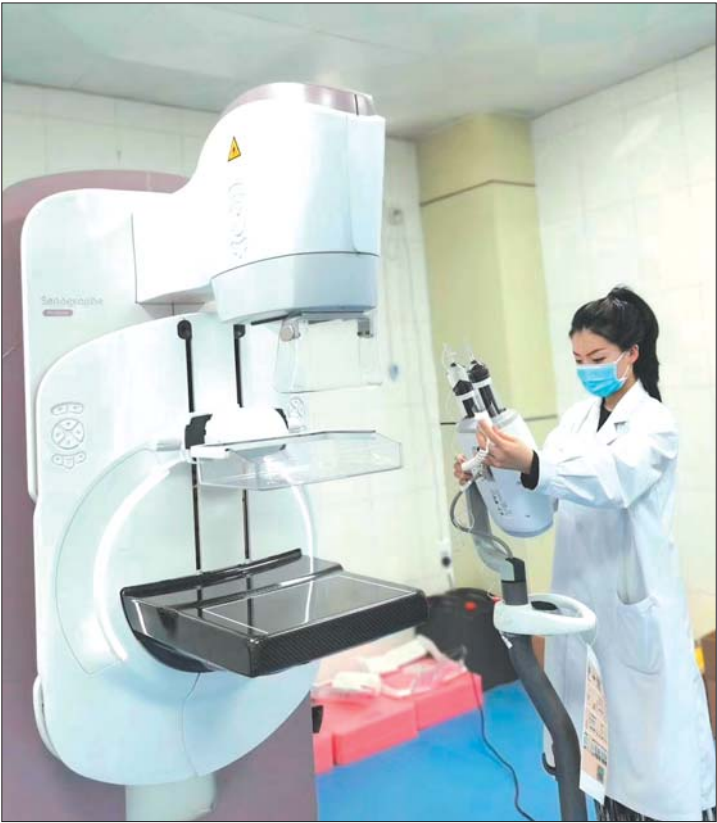
工作人员正在操控最新引进的钼铑双靶X摄影机。

近日,济阳区中医医院引进一台最先进,最高端的美国GE公司生产的乳腺疾病诊断专用检测设备,具有常规摄影、增强(CESM)及定位穿刺活检治疗三合一的高级功能,是国内最先进的乳房检测设备,也是诊断早期乳腺癌的金标准;它可作为一种无创性的检查方法,比较全面准确地反映出整个乳房的结构。能够比较可靠地鉴别出乳腺的良性病变和恶性肿瘤。该项检查操作简便,分辨率极高,不受年龄、体形的限制,无创伤,它可以检测出医生触摸不到的乳腺肿块,特别是针对大乳房和脂肪型乳房,其诊断性极高。 该设备具有以下几方面独特的价值: 1.比较可靠地鉴别出乳腺的良性病变和恶性肿瘤; 2.可以早期发现乳腺癌,甚至能够检查出临床上未能触到的隐匿性乳癌; 3.可发现某些癌前期病变,