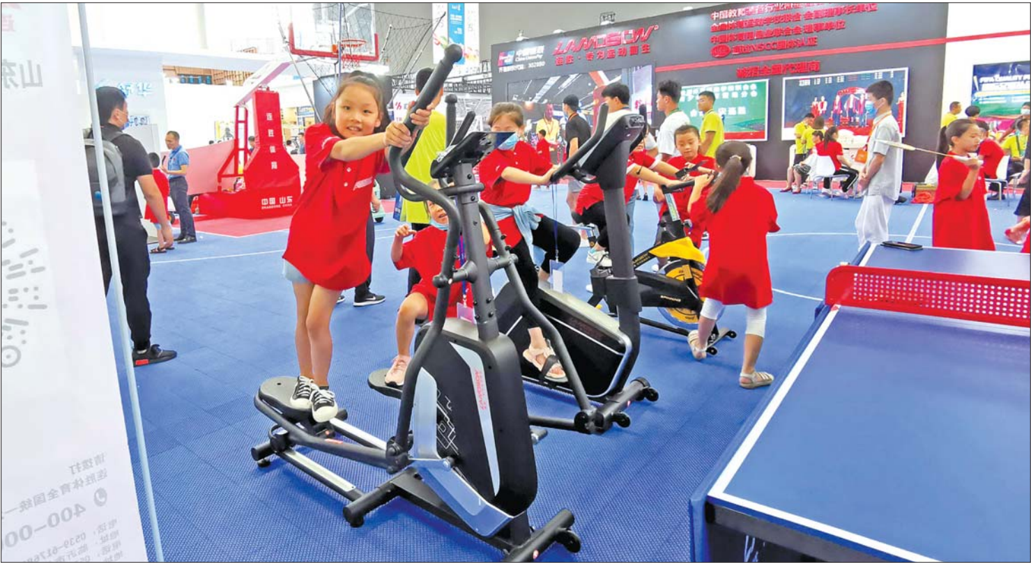
山东(临沂)体博会吸引了众多参观者的关注。