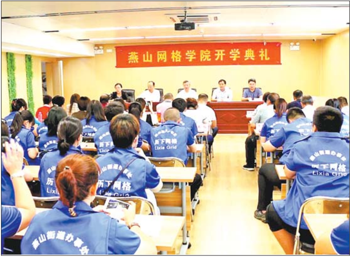
为更好地对网格员队伍进行管理、教育和培训,历下区分别在区委党校和燕山街道挂牌成立了“网格学院”。