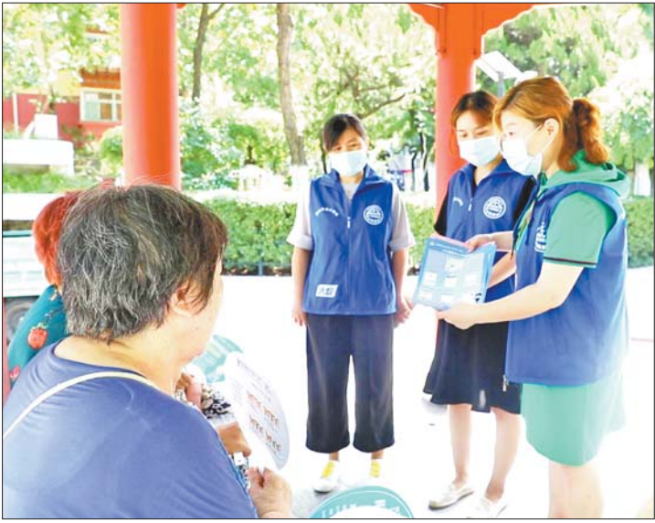
专职网格员来自社区、居住在格内,具有基层情况熟、开展工作快等优势。