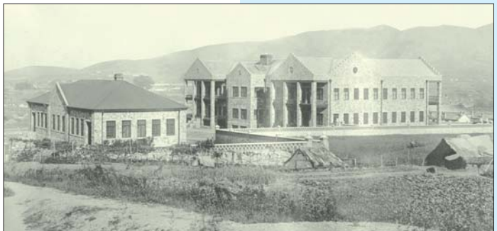
1914年时的烟台毓璜顶医院

1914年,烟台毓璜顶医院正式开业,设置床位100张,占地面积8653平方米,建筑面积6262平方米,全部建筑均采用优质花岗岩,依照当时世界上最先进的建筑理念设计,配有冷、暖水供应。当时,医院门诊为综合门诊,病房分设男女房间,有内科、外科、妇产科、皮肤科、小儿科等专业,能够开展肝脓肿引流术、脾切除术、膀胱取石术、乳腺癌根治术、骨折牵引复位术、截肢术、白内障摘除术、疝修补术、子宫全切除术和耳部癌肿根治术等多种外科手术,甚至还具备了开颅手术的能力,其医疗技术水平在社会上享有盛誉。医院还附设了一