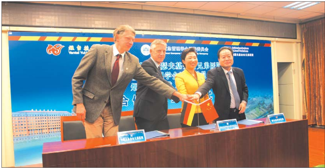
医院与国际知名医疗机构签署合作协议