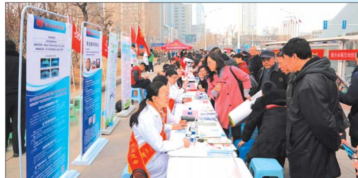
医院每年开展社区义诊等公益活动600余次