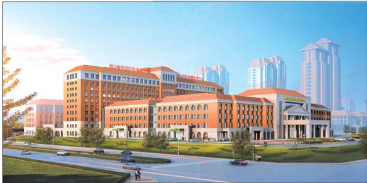
即将投入使用的莱山院区