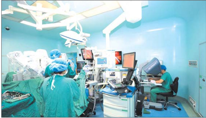
达芬奇机器人手术系统

教育提升岗位能力,培训造就职业素质。医院是青岛大学附属医院,山东大学、大连医科大学、滨州医学院、潍坊医学院的教学医院和研究生培养基地,也是国家级全科医师培训基地,全国住院医师规范化培训基地。近年来,医院投入3000余万元建设了国内一流的临床技能培训中心,配置了国际先进的高仿真模拟设备,每年为超过千名的研究生、本科生、专科学、进修生和规培医生提供高水平的理论教学和实习培训,连续多年获得青岛大学“临床教学先进单位”“教学管理先进集体”等荣誉称号。