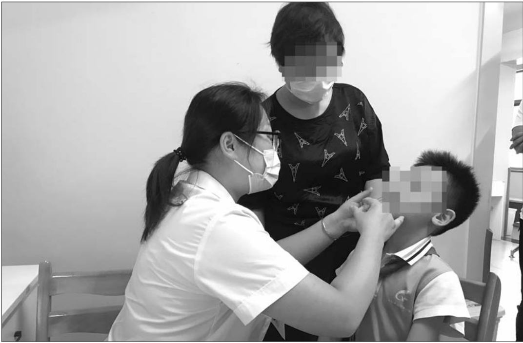
仅需在鼻孔内各喷一下即可完成流感疫苗接种。