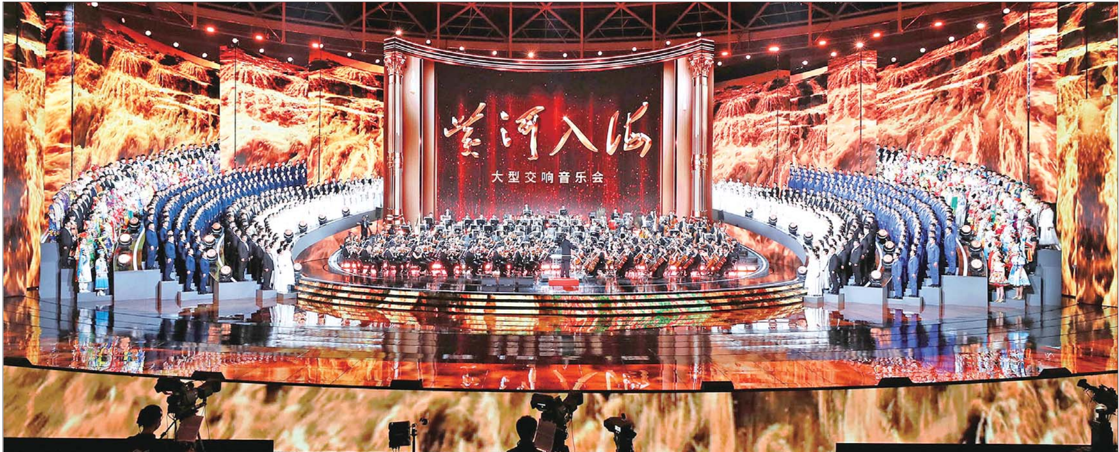
9月16日晚,大型交响音乐会《黄河入海》在济南奥体中心东荷体育馆震撼上演。