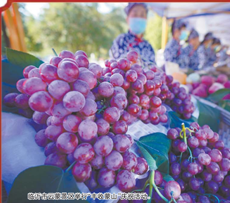
临沂市云蒙景区举行“丰收蒙山”庆祝活动。

习近平指出，今年丰收来之不易，全国广大农民和基层干部发扬伟大抗疫精神，防控疫情保春耕，不误农时抓生产，坚持抗灾夺丰收，为保持经济社会大局稳定提供了有力支撑。习近平强调，各级党委和政府要切实落实好党中央关于“三农”工作的大政方针和工作部署，在全社会形成关注农业、关心农村、关爱农民的浓厚氛围，让乡亲们日子越过越红火。 据新华社