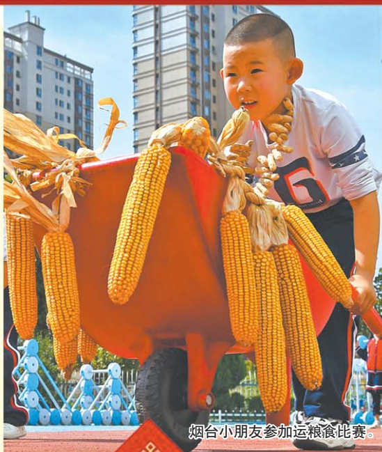
烟台小朋友参加运粮食比赛。