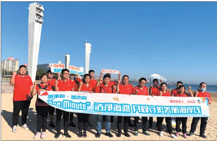
19日，参加活动的员工们合影留念。